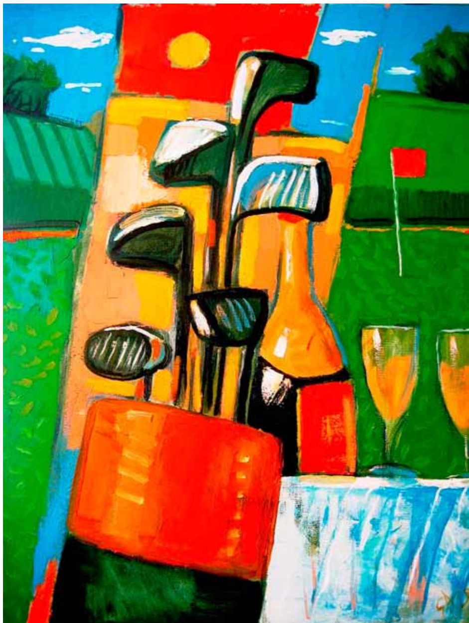
ZÁTIŠÍ NA GREENU

stačit, abych namaloval všechno, co jsem zažil, co jsem slyšel od jiných nebo co jsem viděl ve filmech. Dokud budu držet štětec, budu se snažit něco říct o lásce.