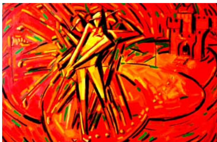
MÍČ DO ZÁMKU – INSPIROVÁNO BENÁTKAMI NAD JIZEROU